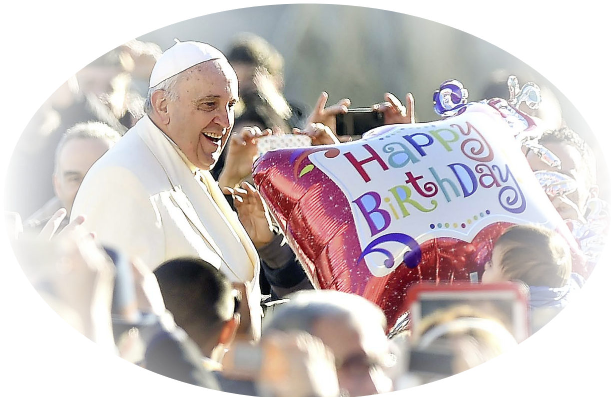
So war es in früheren Jahren (Foto von 2014). Anders als damals merkt man Papst Franziskus im Vorfeld seines 88. Geburtstags sein Alter durchaus an. Dennoch ist es unpassend, jetzt schon von seinem „Vermächtnis“ zu reden. Franziskus hat noch einiges vor.